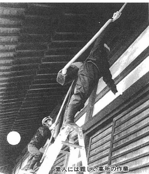
素人には難しい高所の作業