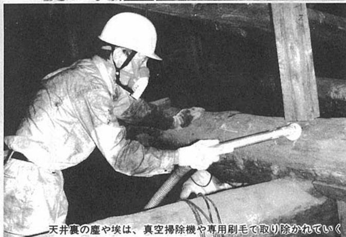
天井裏の塵や埃は、真空掃除機や専用刷毛で取り除かれていく

というのも、長念寺の本堂は、格天井の鏡板や壁面、柱の一部に彩色が施され、また欄間の彫刻には金箔が押されているところがある。いずれも老朽化が著しい。下手にいじられたら、絵の具や金箔が剥げて、掃除どころか、逆に台なしになってしまうのではないかと気遣われたか