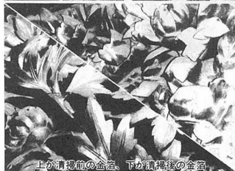
上が清掃前の金箔、下が清掃後の金箔