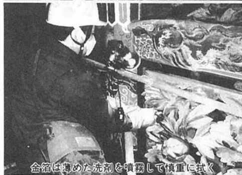
金箔は薄めた洗剤を噴霧して慎重に拭く