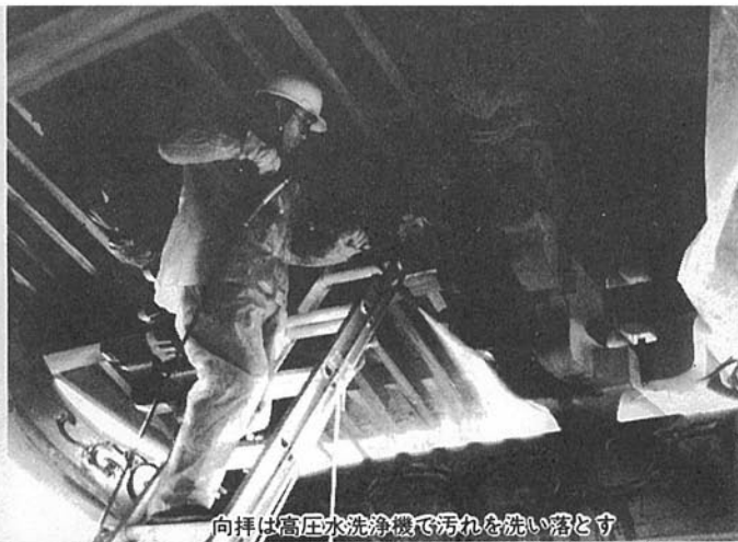
向拝は高圧水洗浄機で汚れを洗い落とす