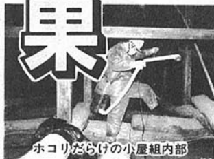
ホコリだらけの小屋組内部

本堂の高い欄間にこびりついた塵、天井裏に積もった砂埃、軒廻りに構う鳥の糞——一度はきれいにしなければならぬ、と思っはいるのだが、なかなか素人の手には負えない建物の汚れだ。暮れの大掃除のときも、結局はそのまんま、というお寺が多かったのではなからうか。