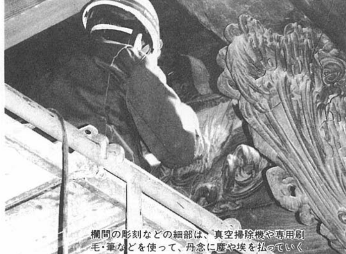
欄間の彫刻などの細部は、真空掃除機や専用刷毛・筆などを使って、丹念に塵や埃を払っていく

掃などを除いて、ほとんど薬品は使われない。もちろん、一時流行った化学的なあく抜き剤で、古くなった木を白くするような方法とは無縁だ。ただ掃除機と刷毛が主役の、地味な手作業の繰り返しである。